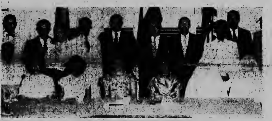
Hunto cu directiva di A.N.V. e maestronan y nan famia, aki ta e alumnonan di MULO cu e anja aki a hanja e mihor cijfer pa hulandes.

ORANJESTAD. — Ayera nachi tabata como huesped di Algemeen Nederlands Verbond na Tracadera, cinco mucha muher y un mucha homber, tur ta muchanan cu a haci M.U.L.O. examen y cu tabata e mihor den e idioma Hulandes, af mihar bisa a hanja un ocho of mas pa e idioma aki. A.N.V. kier a premiar nan pa esaki, ya cu e obheto di A.N.V. ta pa nan usa e idioma aki mas tanta possible den exterior.